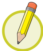
Crayon de plomb